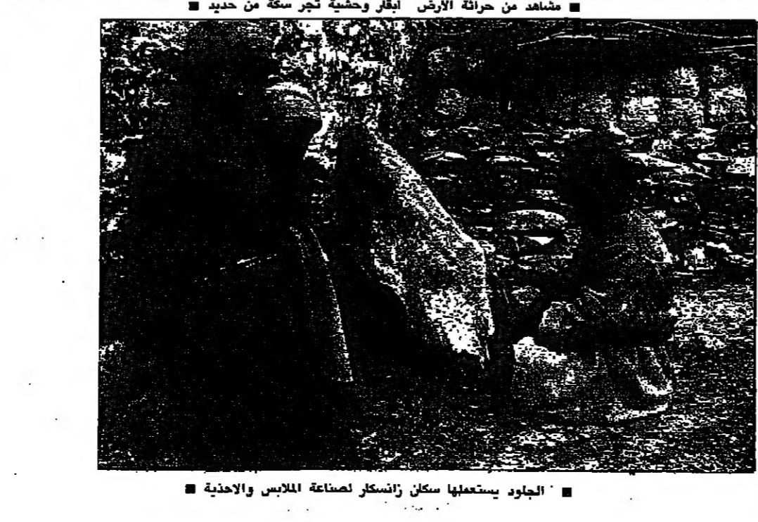
الجلود يستعملها سكان زانسكر لصناعة الملابس الاحذية